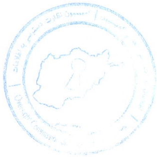
زهرا موسوی کمیشنر کمیسیون